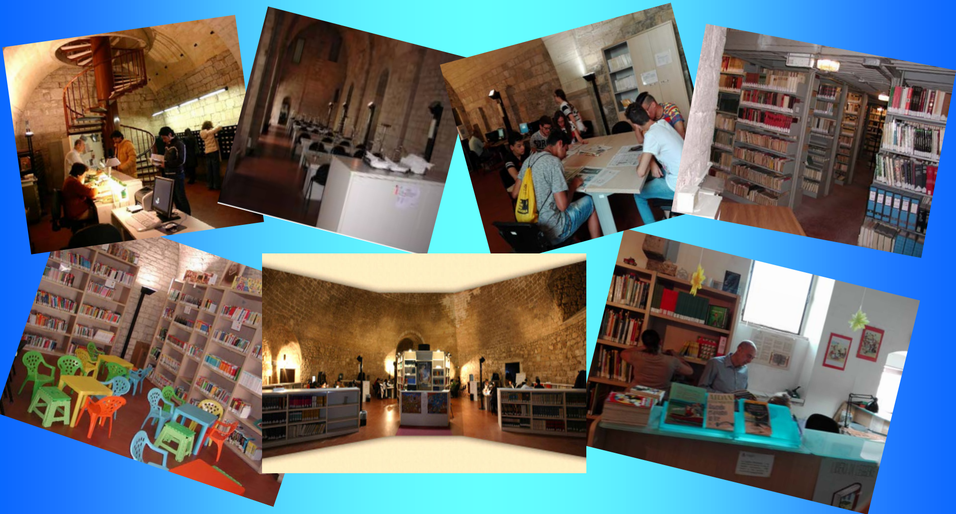
Illustrazione spazi, servizi e patrimonio librario della biblioteca